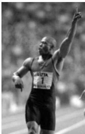
モーリス グリーン

筋肉細胞が収縮できるようになるためには自由エネルギーを与えてやる (input) が必要である。(このような) エネルギー伝達を行うひとつの生化学的経路は、グルコースのピルビン酸への分解であり、これは解糖とよばれている。細胞中において、十分な酸素の存在下、ピルビン酸はさらなるエネルギーを得るために \text{CO}_2 と \text{H}_2\text{O} にまで酸化される。一方、極端な条件下、たとえばオリンピックの 100 m 短距離走のような場合は、血液は十分な酸素を運んでくることができない。このため筋肉細胞は以下の反応により乳酸を生じる。